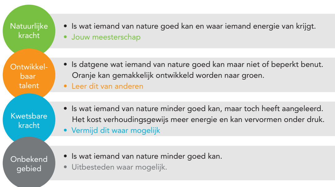
Figuur 1 Schematisch overzicht van de uitslag van een ODC-meting naar de wijze waarop een archetype geleefd kan worden.

“Het meest heftige scenario dat kan voorkomen is wanneer het archetype ‘De strateeg’ wordt geleefd vanuit aangeleerd gedrag, er een onderliggende psychische stoornis aanwezig is én alle hiërarchische bevoegdheden van een organisatie in deze ene individu samenkomen.”